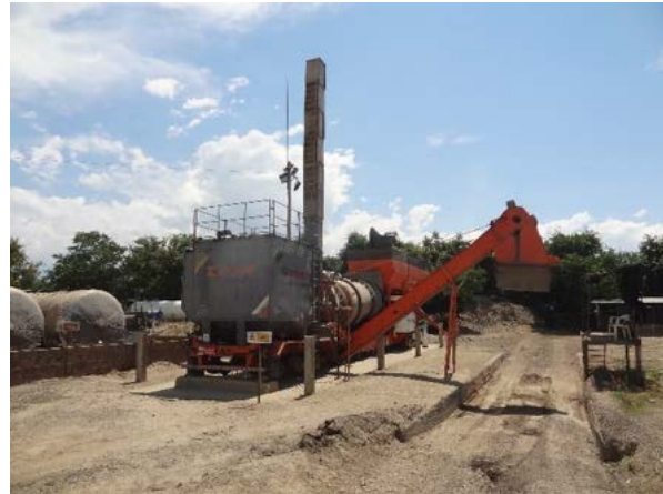
Fotografía 13. Planta de asfalto portátil ubicada en el campamento Papagayo, utilizada para la fabricación de asfalto requerida en la UF 01