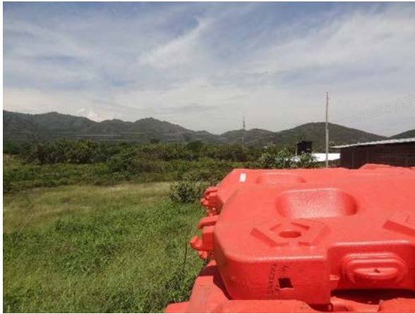
Fotografía 17. Zonas aledañas al campamento Papagayo, se observa total ausencia de habitantes o viviendas, y presencia de vegetación herbácea de bajo porte.