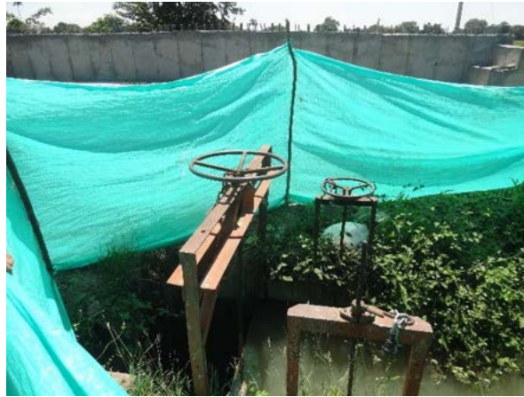
Fotografía 10. Protección de compuertas de canales de Usucoello, se observan polisombras y barreras para evitar aporte de sedimentos o contaminación del agua