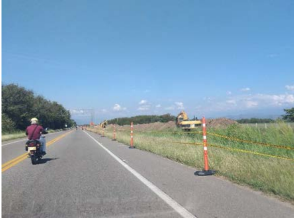
Fotografía 1. Se observa el descapote ubicado en el costado de la nueva calzada en construcción de la UF 05 (Flandes)