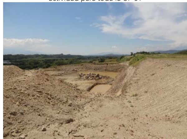
Fotografía 9. Zona de extracción de material de cantera MASSEQ, ubicado entre el río Magdalena y el Campamento Papagayo.