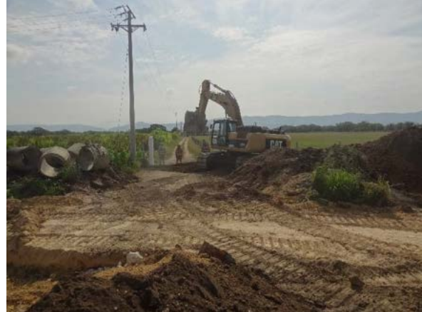
Fotografía 2. Obras de la nueva calzada UF 05, se observan las adecuaciones para proteger afectaciones de acceso a predios