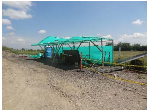
Fotografía 5. Frente de obra cercanías quebrada Santa Ana