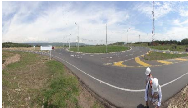
Fotografía 7. Intersección Yaguara, se observan avances en revegetalización, se estima un 80% en esta actividad para toda la UF 01