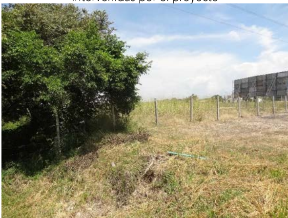
Fotografía 8. Zona correspondiente a la ZODME 1 de la UF 01, se observa adecuada recuperación, protección de afectación de zonas aledañas y revegetalización.