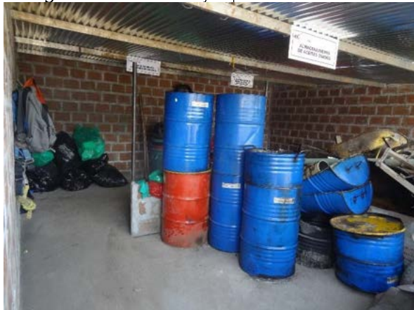
Fotografía 15. Acopio de residuos (Incluye peligrosos), lo residuos están fuera del alcance de las lluvias, están debidamente identificados.