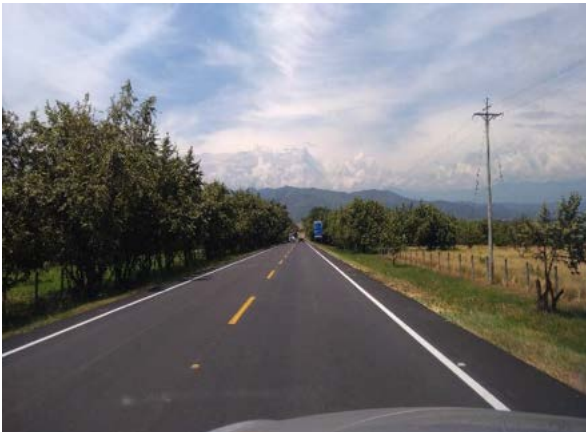
Fotografía 6. Calzada de la UF 01, finalizadas las obras, se observan cercas vivas que no fueron intervenidas por el proyecto