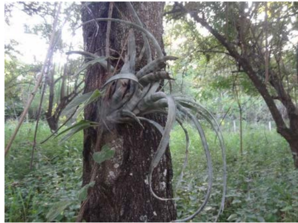
Fotografía 11. Epífitas vasculares provenientes de la UF 01, trasladadas a hospederos ubicados en el campamento Aipe, se observan poco afirmados el hospedero y con marchitamiento parcial, se recomienda fortalecer los mantenimientos