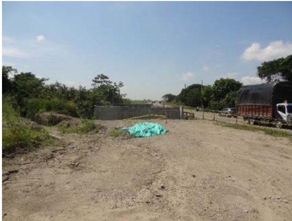
Fotografía 4. Obras en cercanías a quebrada Santa Ana.