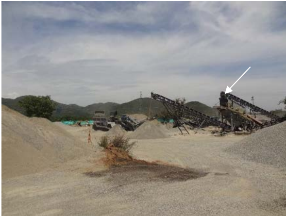
Fotografía 12. Trituradora ubicada en el campamento Papagayo, se señala el punto donde se humedece el material previo al triturado