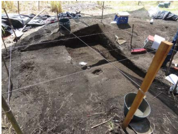
Fotografía 14. Trincheras y exploración de material arqueológico en el par vial, previo al inicio de la construcción